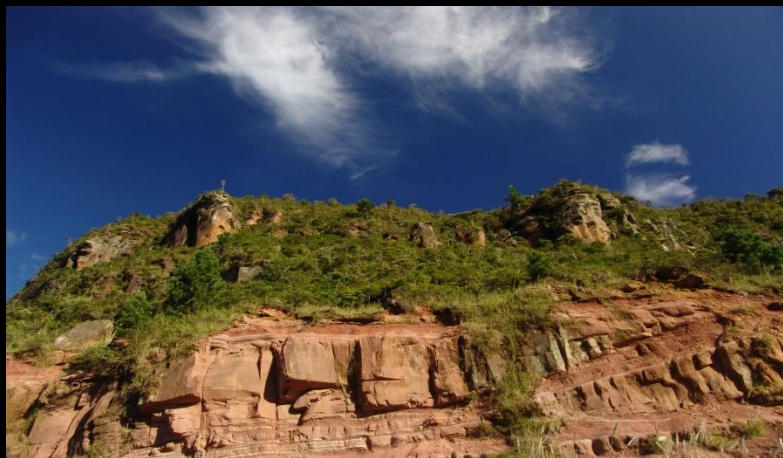
Afloramento de arenito avermelhado de origem desértica, em Santa Catarina. Estas rochas da chamada Formação Botucatu constituem o reservatório do Aquífero Guarani, um dos mais conhecidos e discutidos atualmente no Brasil.